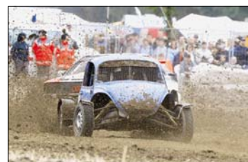
Wer braucht schon Kotflügel? Erlaubt war (fast) alles, was der Vollgas-Fraktion Spaß macht.